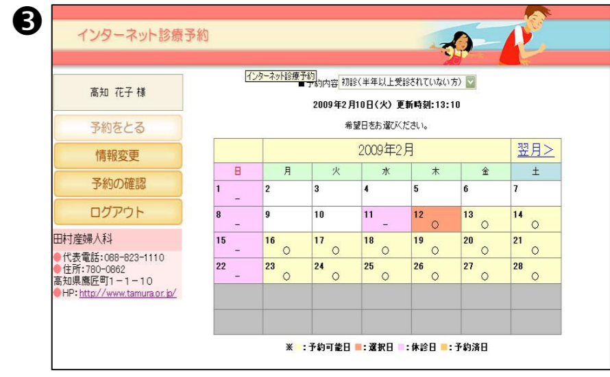
③ 予約をしたい日にちを選択します。