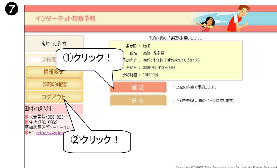
⑦予約日時を確認後、【確定】ボタンをクリックし、画面が変わったら【ログアウト】ボタンをクリックします。