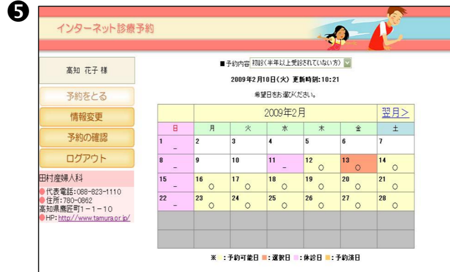
⑤予約をしたい日にちを選択します。