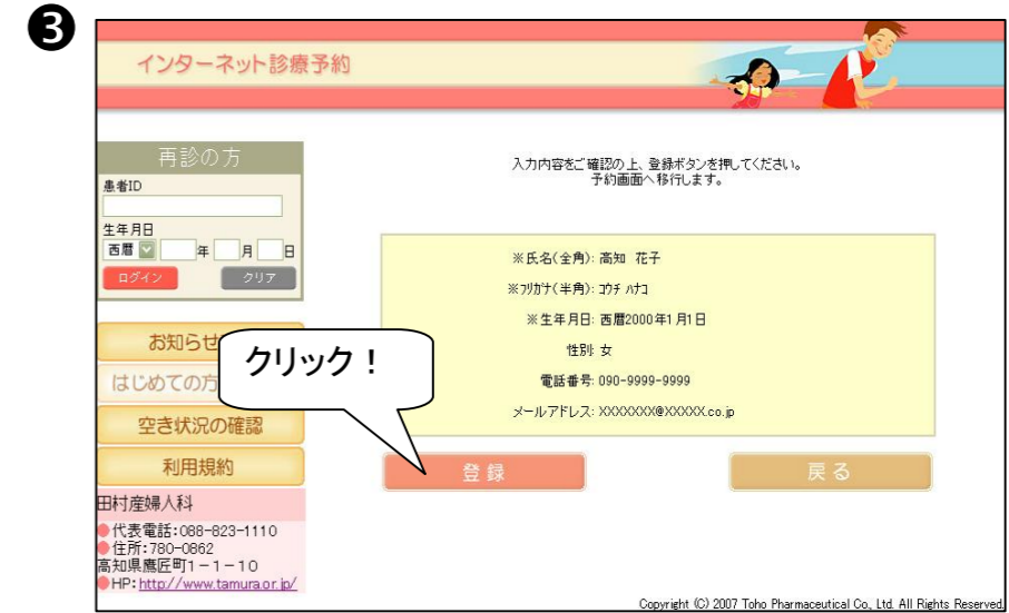
③入力内容に間違いがなければ【登録】ボタンをクリックします。