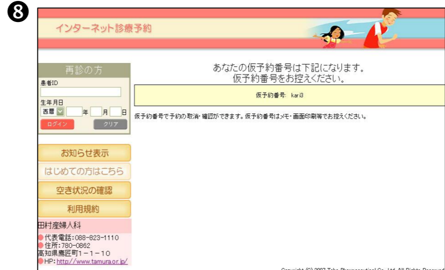
⑧仮番号が発行されます。予約の確認や取消の際に必要なになりますのでお控え下さい。

※その他の機能 空き状況の確認 予約したい科目の空き状況を確認することができます。