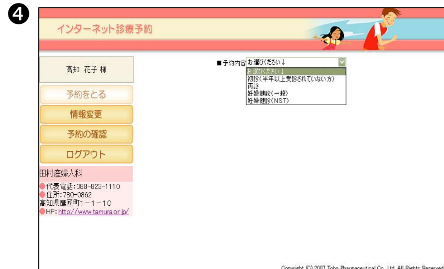
④【予約をとる】をクリックし、予約したい科目を選択します。