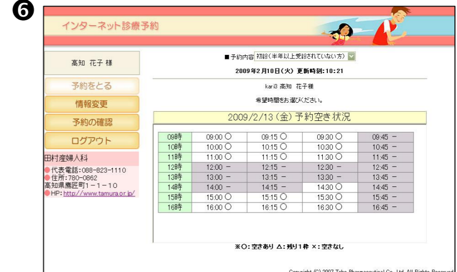
⑥予約をしたい時間を選択します。