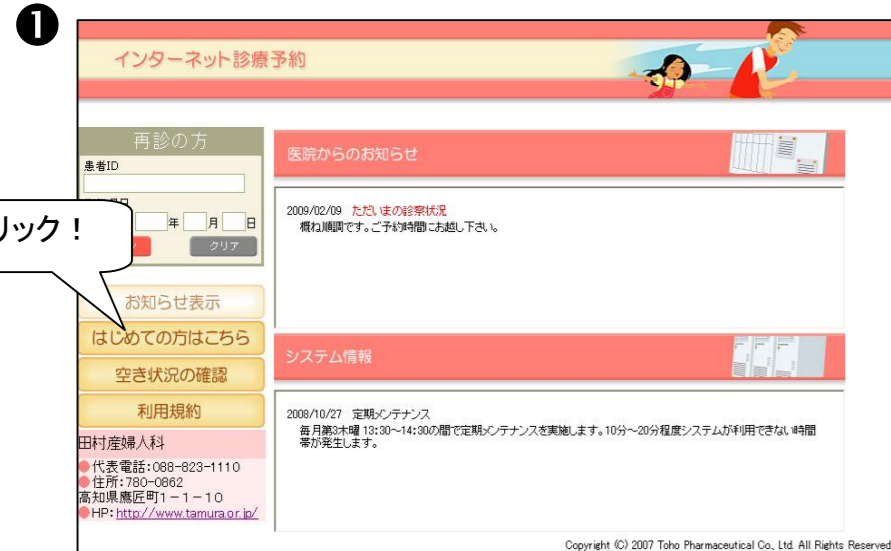
①【はじめての方はこちら】をクリックします。